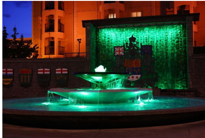
C.-B. Legislative Grounds, Victoria

Pour être bénévole pour CCHC, veuillez cliquer sur l'onglet « Contactez-nous » à www.myhcc.ca et envoyez-nous un message. Nous serons ravis de vous entendre.